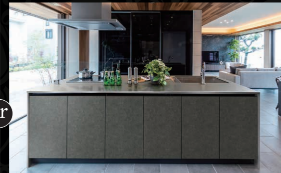
ワークトップ ステンレスカウンター