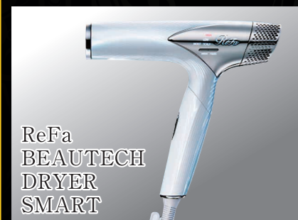
ReFa BEAUTECH DRYER SMART