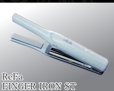
ReFa FINGER IRON ST

※当社指定品となります。詳しくは担当営業にお問い合わせください。商品は着工後のお渡しになります。写真はイメージです。