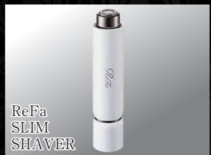
ReFa SLIM SHAVER