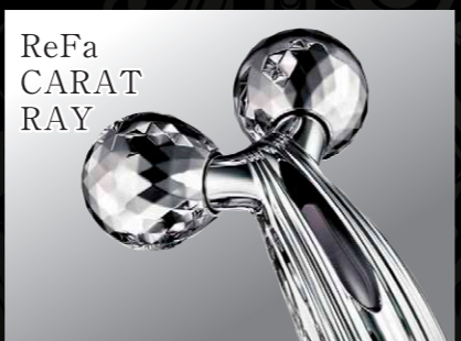
ReFa CARAT RAY