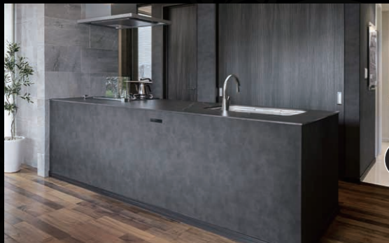
ワークトップ ウルトラセラミックストーン