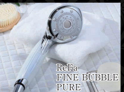
ReFa FINE BUBBLE PURE