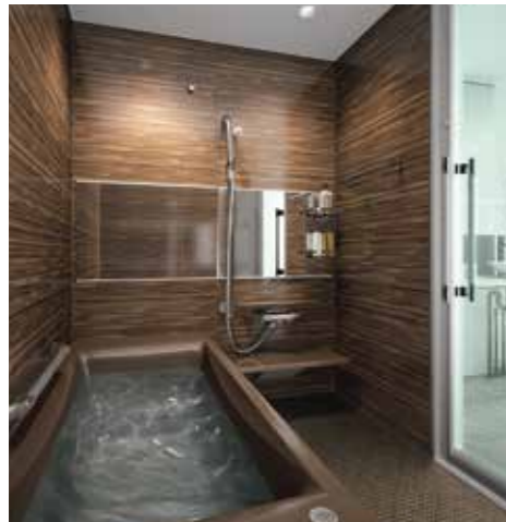
ウルトラファインバブル*シャワーヘッド

普段目にする通常の泡よりもずっと小さく、特異的な洗浄のメカニズムを持つ2つの泡で肌本来の美しさを引き出します。