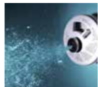
ウルトラファインバブル*浴槽

普段目にする通常の泡よりもずっと小さく、特異的な洗浄のメカニズムを持つ2つの泡で肌本来の美しさを引き出します。