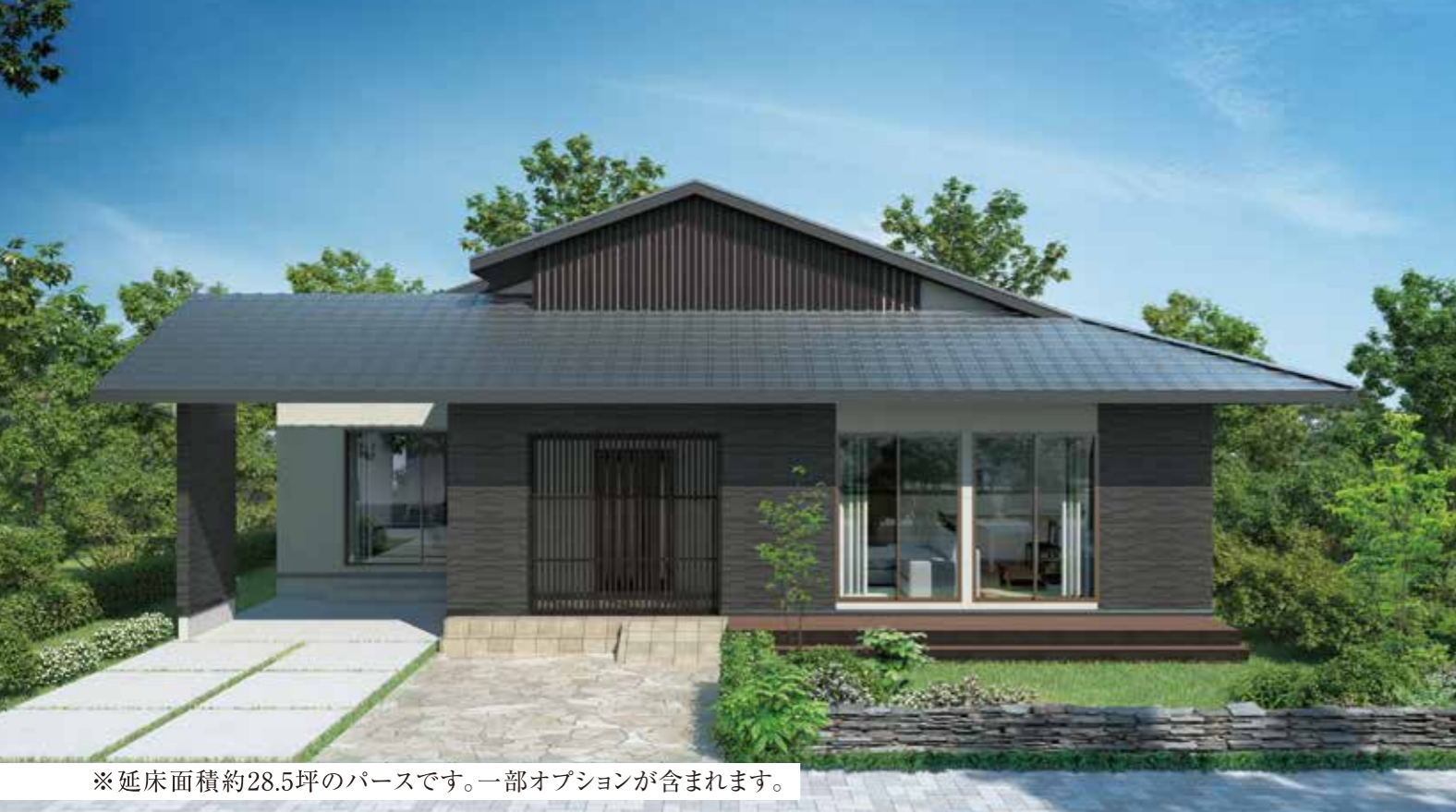
※延床面積約28.5坪のバースです。一部オプションが含まれます。