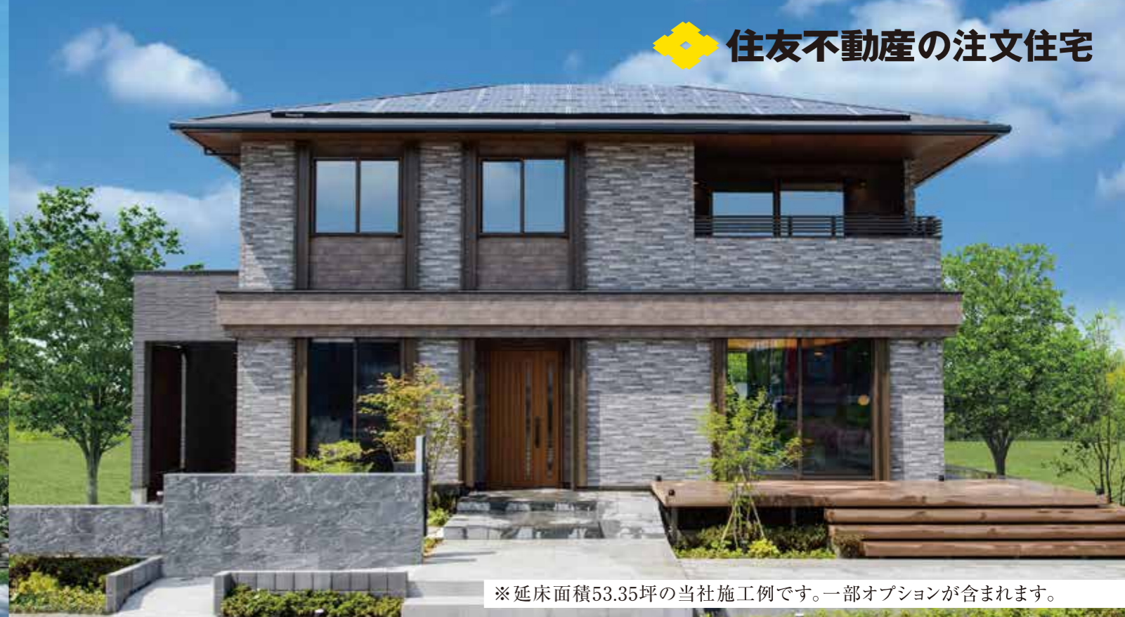
※延床面積53.35坪の当社施工例です。一部オプションが含まれます。