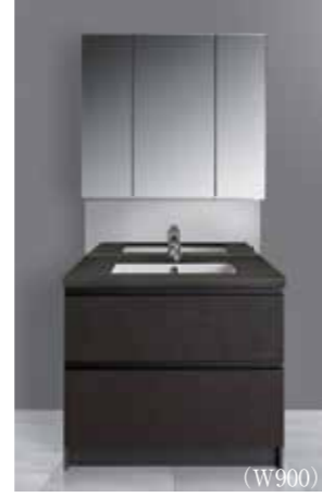
クォーツストーンカウンター