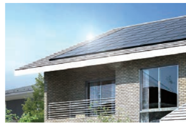
太陽光発電システム