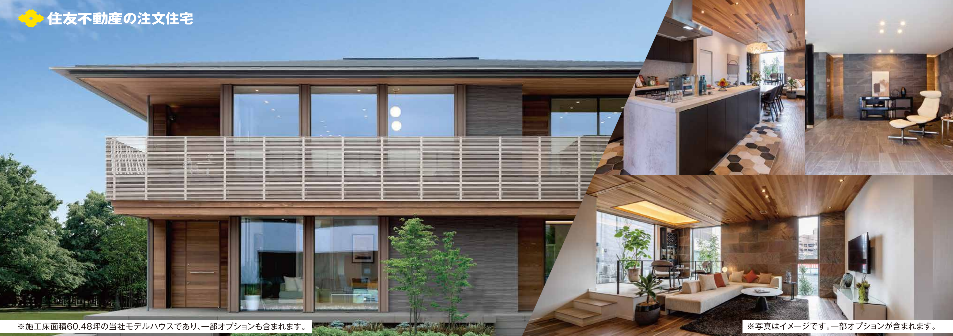
※施工床面積60.48坪の当社モデルハウスであり、一部オプションが含まれます。